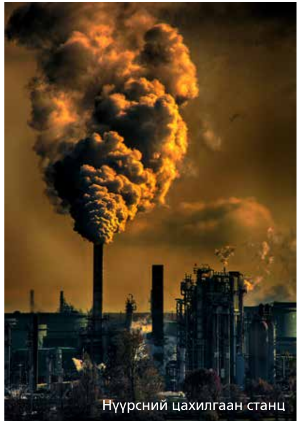
Нүүрсний цахилгаан станц

Нөгөө талаас, Эрдэнэс Монголын охин компаниуд нэг бол өөрийн гэсэн охин компани байгуулсан эсхүл бусад оролцогч талуудтай төрөл бүрийн хамтарсан компани болж гэрээ байгуулсан байдаг. Жишээлбэл, Мон-Атом компани ураны төсөл хэрэгжүүлэх дор хаяж гурван хамтарсан компанид хувь эзэмшиж байгаагаас Мон-Чех Ураны 51 хувь, Бадрах Энержигийн 34 хувь, Гурвансайханы 15 хувийг тус тус эзэмшдэг.