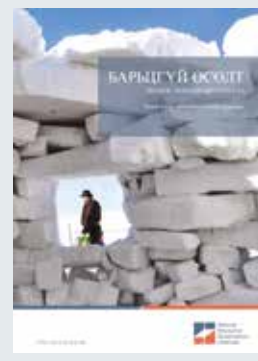
Зураг. Эрдэнэс Монголын хувь эзэмшил

Энэ хураангуйг Барьцгүй өсөлт: Эрдэнэс Монголын үнэлгээ тайланг үндэслэн бэлтгэсэн бөгөөд уг тайланг www.resourcegovernance.org/erdenes-mongol хаягаар авч болно