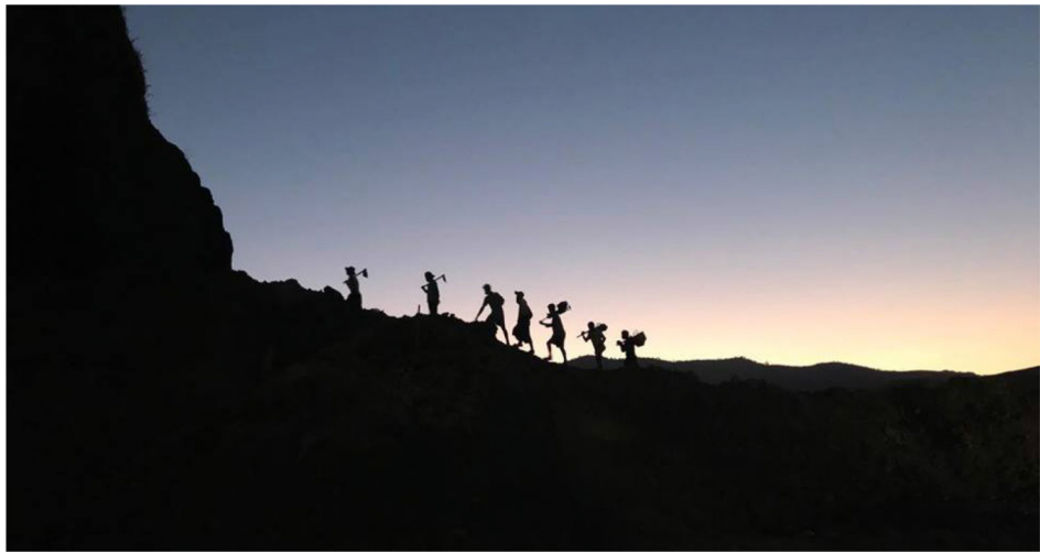
ကချင်ပြည်နယ် ဖားကန့် ဒေသရှိ တရားဝင်မဟုတ်သော လုပ်ကွက်တွင် တူးဖော်နေသည့် ကျောက်စိမ်းတူးသူများ

ပုဂ္ဂလိက ကဏ္ဍပိုင်းမှ အခက်အခဲများကို သတိရှိခြင်း၊ အရည်အသွေးမြင့်သော တာဝန်သိသော ရင်းနှီးမြှုပ်နှံသူများကို ဆွဲဆောင်ရန်အတွက် မည်ကဲ့သို့ စီစဉ်မှုများ ပြုလုပ်ရမည်ကို ထည့်သွင်းစဉ်းစားမှုများ ပြုလုပ်ခြင်းသည်လည်း အကျိုးဖြစ်ထွန်းစေသည်။ ဥပမာအားဖြင့် အာဂျင်တီးနားသည် တစ်နိုင်ငံလုံးအတိုင်းအတာ စုစည်းထားသည့် ကြေးတိုင်စနစ် အသုံးပြုရန် ၁၉၉၀ ခုနှစ် အစောပိုင်းတွင် ဆုံးဖြတ်ချက်ကြောင့် မြေပိုင်ဆိုင်မှု အရပ်အရင်းကိစ္စများနှင့် ဆက်နွယ်နေသည့် ပြဿနာများကို ဖြေရှင်းရာတွင် အထောက်အကူဖြစ်စေခဲ့ပြီး ရင်းနှီးမြှုပ်နှံသူများ၏ ယုံကြည်မှုကို အားကောင်းစေခဲ့သည်။ ၁၈ ၎င်းနှင့် ဆန့်ကျင်ဘက်အဖြစ် အင်ဒိုနီးရှားနိုင်ငံ၏ လိုင်စင်ချထားပေးခြင်းဆိုင်ရာ ဆုံးဖြတ်ချက်များကို ဗဟိုချုပ်ကိုင်မှု လျော့ချခြင်းနှင့် ဆက်စပ်ပေါ်ပေါက်ခဲ့သည့် အခက်အခဲများကြောင့် နိုင်ငံ၏ သတ္တုကဏ္ဍသို့ ဝင်ရောက်ရင်းနှီးသူများကို လျော့ကျသွားစေခဲ့သည်။