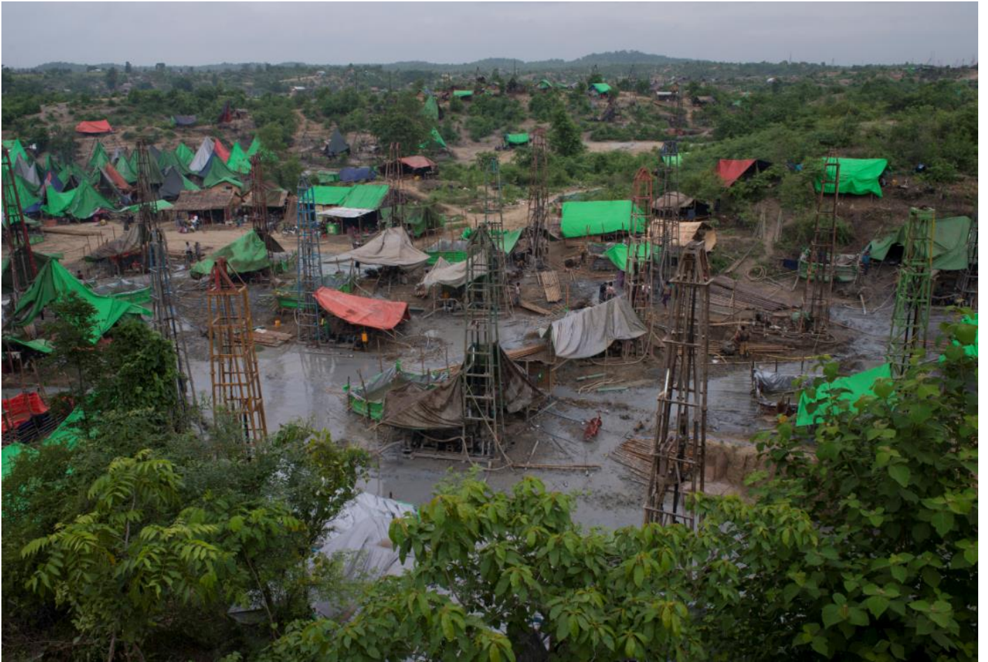
မြန်မာနိုင်ငံမှ ကုန်းတွင်းရေနံတွင်းများ