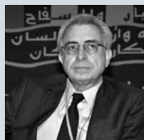
Ernesto Zedillo (presidente)